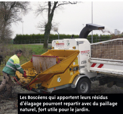
Les Boscéens qui apportent leurs résidus d'élagage pourront repartir avec du paillage naturel, fort utile pour le jardin.

Voir ou revoir les vœux du maire aux Boscéens http://bouaye-avance.fr/ ●