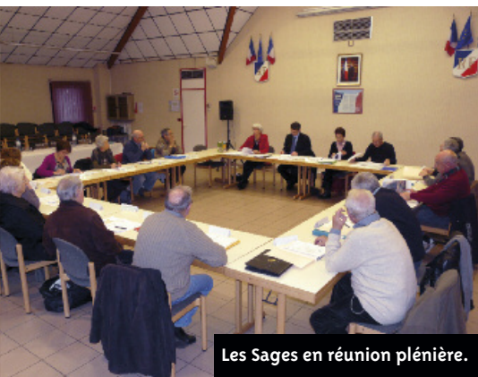
Les Sages en réunion plénière.