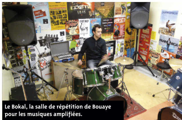
Le Bokal, la salle de répétition de Bouaye pour les musiques amplifiées.

Le Bokal est le nom de la salle de répétition des musiques amplifiées de Bouaye. Chaque début d'année marque le renouvellement des adhésions des groupes et artistes au Bokal, un lieu au service de la culture, de la musique et peut-être de l'artiste qui sommeille en vous ?