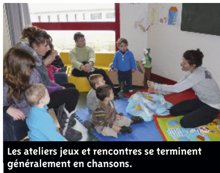
Les ateliers jeux et rencontres se terminent généralement en chansons.

* Les ateliers ont aussi lieu à Brains, à Saint-Aignan-de-Grand-Lieu et à Bouaye (à l'accueil périscolaire).