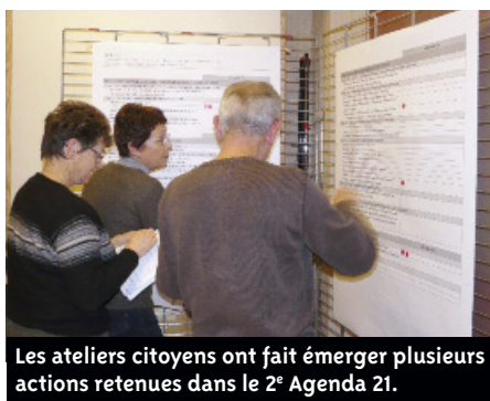
Les ateliers citoyens ont fait émerger plusieurs actions retenues dans le 2 e Agenda 21.

Au cours de l'élaboration du 2 e Agenda 21 de la Ville, l'accent a été mis sur la concertation. Un Comité de Pilotage (COPILOT) Agenda 21 a ainsi été créé. Il réunit des élus, des agents municipaux, sept habitants volontaires, un représentant du Conseil des sages, du Conseil Local Economique et de Nantes Métropole. Ce comité a joué un rôle dans l'élaboration et la validation du plan d'actions. En 2010, des ateliers-citoyens ouverts à tous avaient été organisés pour recueillir les propositions d'actions des Boscéens. La première session de ces ateliers-citoyens a fait émerger près d'une centaine de propositions d'actions, priorisées lors de la deuxième session. Au final, 28 actions ont été retenues et dont la plupart est déjà engagée. L'opération de broyage des résidus d'élagage pour les particuliers organisée le 3 mars prochain (voir page 4) est issue des ateliers citoyens.