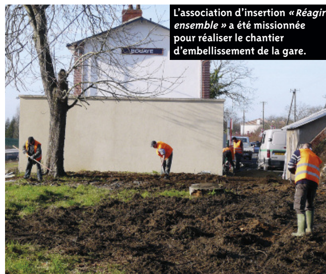
L'association d'insertion « Réagir ensemble » a été missionnée pour réaliser le chantier d'embellissement de la gare.

l'objet d'un état des lieux, puis de propositions d'aménagement en concertation entre l'association d'insertion. « Réagir ensemble », chargée des travaux, la SNCF et le