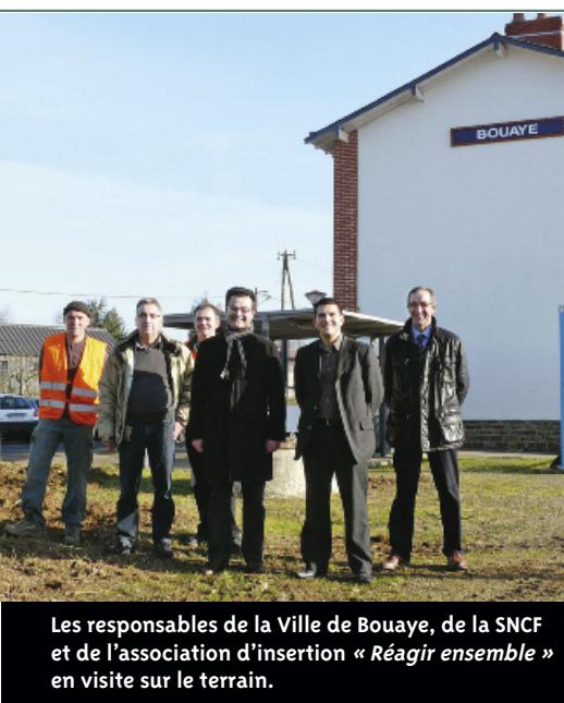
Les responsables de la Ville de Bouaye, de la SNCF et de l'association d'insertion « Réagir ensemble » en visite sur le terrain.

en friche, les abords des deux côtés la gare seront nettoyés, remis à niveau puis engazonnés. Des végétaux, choisis pour leur entretien sans pesticides, seront plantés. Enfin, la clôture sera repoussée de plusieurs mètres afin de faciliter et de sécuriser l'accès aux services espaces verts lors des futures interventions d'entretien ●