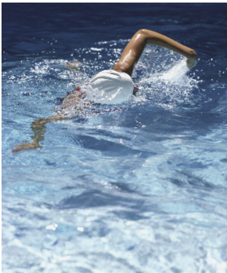
Le SIVOM lancera une étude en 2012 pour définir les conditions d'un projet intercommunal de piscine.

A partir de la fin des années 80, le SIVOM accompagne le développement de son territoire et devient l'outil nécessaire pour construire des équipements d'intérêt intercommunal : nouvelle gendarmerie, hôtel des impôts, piste d'athlétisme, maison du pays d'Herbauges accueillant un service reprographie et le Relais d'Assistantes Maternelles (RAM) furent ainsi bâtis sur deux décennies. Durant cette période, la commune de Pont-Saint-Martin se retira du SIVOM pour constituer une intercommunalité avec Saint-Philbert. Ces dernières années, considérant le nombre significatif de sportifs extérieurs à la commune inscrits dans les clubs boscéens, le SIVOM apporta une contribution financière de 1 196 000 € au budget de construction du nouvel ensemble sportif de Bellestre.