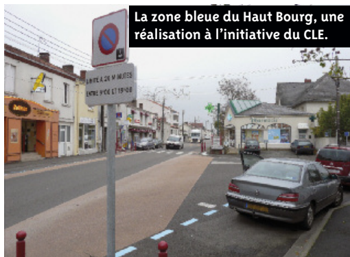
La zone bleue du Haut Bourg, une réalisation à l'initiative du CLE.

Le CLE est une assemblée consultative de réflexion. Ses membres bénévoles représentent la diversité de l'économie locale : commerçants, artisans, entreprises, métiers de la terre, professions libérales, associations et syndicats professionnels. Elus par leurs pairs au printemps 2010, ils se retrouvent sur invitation de la Ville ou de leur propre initiative pour étudier des sujets d'intérêt ayant rapport avec le développement économique de la commune. Après un temps de recherche et de réflexion, le CLE soumet des propositions d'actions au Conseil municipal. Certaines propositions à l'initiative du CLE se sont concrétisées. Le dernier exemple en date est la zone bleue créée pour améliorer la rotation régulière des véhicules stationnés près des commerces du Haut Bourg.