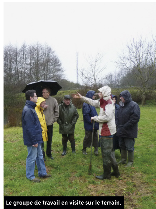
Le groupe de travail en visite sur le terrain.

En 2011, une équipe de Boscéens volontaires a été constituée pour inventorier les zones humides sur le territoire de Bouaye. Leur connaissance de la commune est un atout pour effectuer ce travail précis engagé avec un bureau d'étude spécialisé, les services de Nantes Métropole et de la Mairie. La carte des zones humides servira de document référence pour leur préservation. L'enjeu est double car les zones humides contribuent à la préservation de la qualité de l'eau et à limiter l'impact des crues.