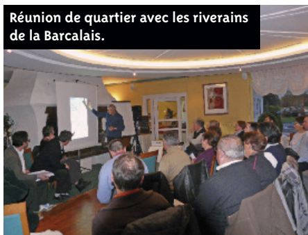
Réunion de quartier avec les riverains de la Barcalais.

Ouvertes à tous, les réunions publiques organisées par la Ville informent directement les Boscéens sur des projets spécifiques (logement, jumelage, développement durable...). Les rencontres de quartier offrent la possibilité aux riverains de connaître les évolutions de leur environnement proche, de poser leurs questions et de formuler leurs demandes. Ces échanges précieux permettent d'intégrer les suggestions dans les projets. Ainsi, à la Barcalais, l'éclairage public a pu être installé en tenant compte des souhaits émis en réunion : les lumières sont coupées entre 23 heures et 6 heures pour économiser l'énergie.