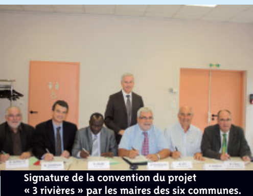
Signature de la convention du projet « 3 rivières » par les maires des six communes.