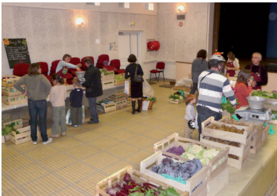
Le Panier Bioscéen permet à 65 foyers d'acheter des légumes bio directement à un producteur local.