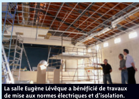
La salle Eugène Lévêque a bénéficié de travaux de mise aux normes électriques et d'isolation.

Les travaux de réhabilitation de la salle Eugène Lévêque se sont terminés juste avant la rentrée, comme prévu. A la demande de la Ville de Bouaye, les entreprises ont profité de la période estivale pour refaire l'installation électrique aux normes actuelles ainsi que l'isolation comprenant la pose de plafonds suspendus et l'installation d'une chaufferie pour réduire la consommation énergétique. Depuis, la salle a accueilli la soirée festive « Le Son du Bokal » qui a affiché complet ●