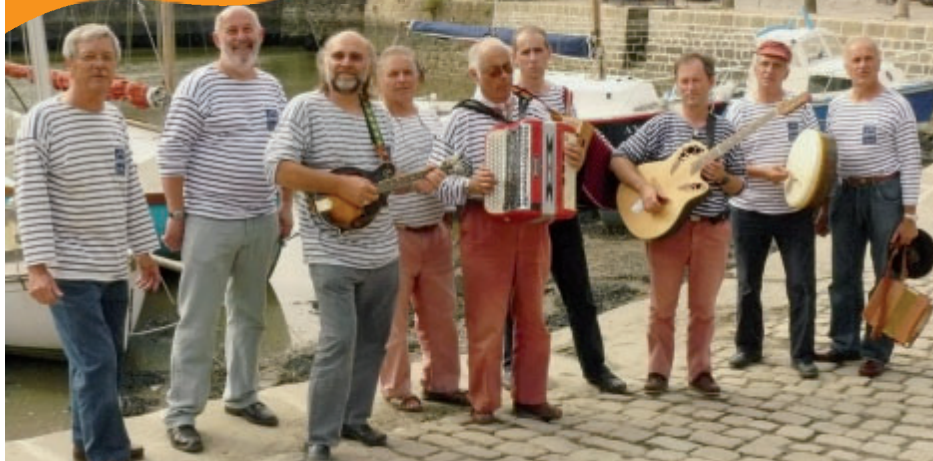
Le groupe Gabare , avec ses 9 chanteurs et musiciens, propose un répertoire de chants de marins et de mariniers