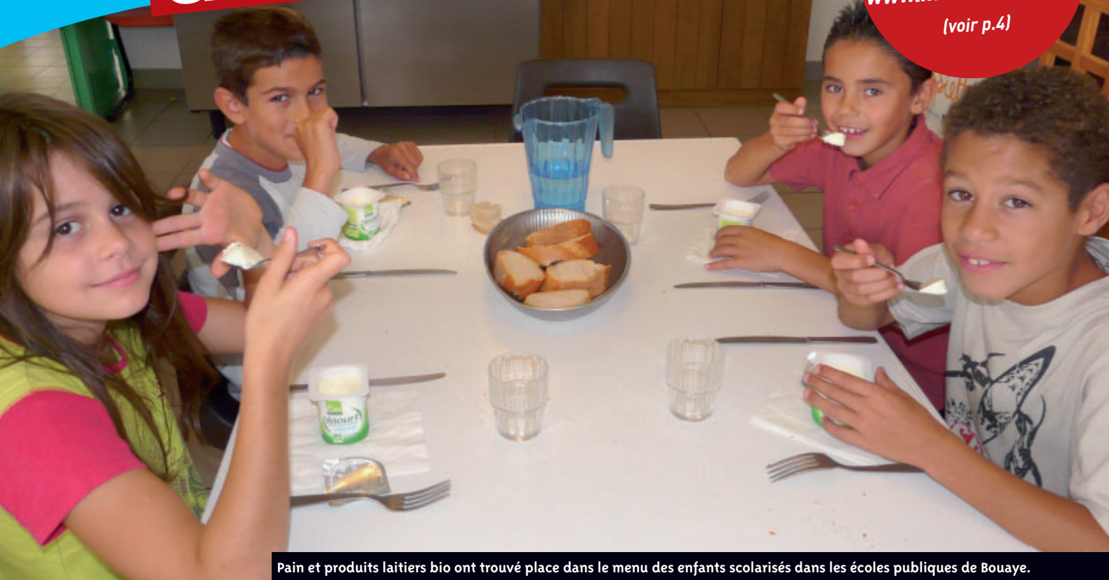
Pain et produits laitiers bio ont trouvé place dans le menu des enfants scolarisés dans les écoles publiques de Bouaye.

Le nouveau site Internet de la ville est en ligne : www.mairie-bouaye.fr (voir p.4)