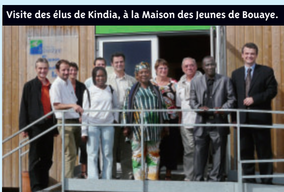
Visite des élus de Kindia, à la Maison des Jeunes de Bouaye.