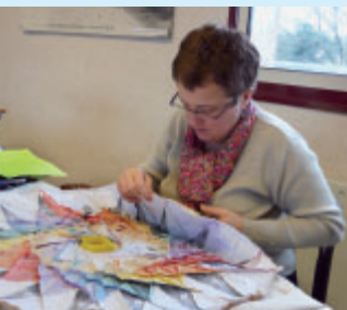
Une initiation gratuite au Patchwork est proposée le 22 octobre.

L'association Le Héron Patchwork existe à Bouaye depuis 10 ans. Elle organise une journée portes ouvertes le jeudi 22 octobre 2009, de 9h à 17h, salle E. Lévêque en préparation du Téléthon des 4 et 5 décembre