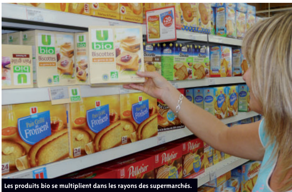
Les produits bio se multiplient dans les rayons des supermarchés.

il faut vérifier la présence du logo français AB Agriculture Biologique, géré par le Ministère de l'Agriculture. Les fruits, légumes, viandes, poissons...labellisés AB respectent le cahier des charges strict de l'agriculture biologique (pas de pesticides, d'engrais, de colorants, d'OGM...) et sont régulièrement contrôlés par des certificateurs indépendants agréés par l'Etat.