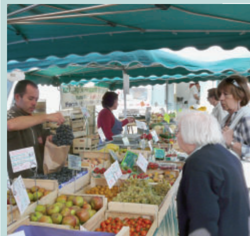
Un producteur de fruits et légumes bio est présent tous les jeudis, sur le marché de Bouaye.