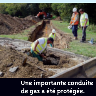
Une importante conduite de gaz a été protégée.

Dans la perspective de la construction des salles de l'ensemble sportif de Bellestre, des travaux préparatoires de sécurité ont eu lieu en octobre. Des plaques de bétons ont été posées sur un lit