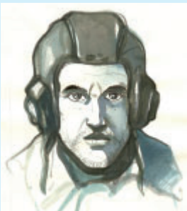
Dessin de Jean-Marie Michaud.

Du 16 novembre au 19 décembre, la bibliothèque municipale de Bouaye organise un festival de la Bande Dessinée avec de nombreux rendez-vous. Plusieurs expositions feront pénétrer les visiteurs dans l'univers passionnant de la