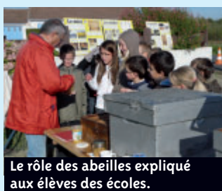
Le rôle des abeilles expliqué aux élèves des écoles.

Dans le cadre de la campagne de sensibilisation à la protection de l'environnement Moi aussi, j'agis ! menée par le Conseil