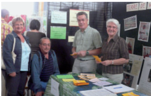
Terre de Vie était présente au dernier forum des associations

A l'occasion du 20 e anniversaire des Droits de l'Enfant, l'association Terre de Vie organise, avec le concours de la municipalité, un week-end de fêtes, de débats et d'échanges à la salle Eugène Lévêque. Renseignements : 02 40 32 60 79.