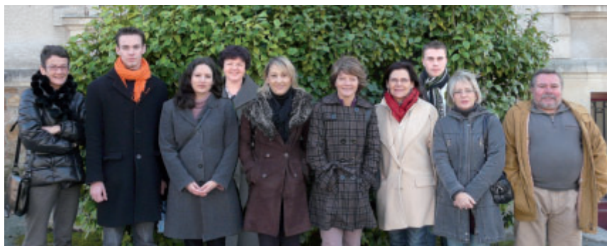
L'équipe des dix agents recenseurs recrutée pour nous compter.

Pour obtenir des renseignements complémentaires, contactez la mairie au 02 51 70 55 55 ou consultez www.mairie-bouaye.fr