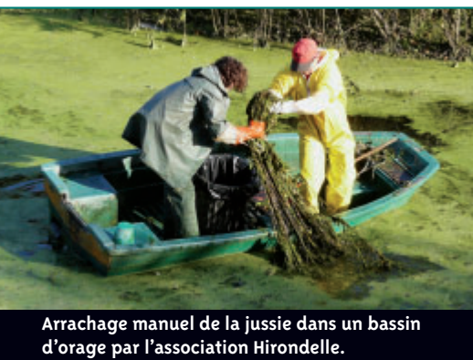
Arrachage manuel de la jussie dans un bassin d'orage par l'association Hirondelle.

tres sous la surface de l'eau, les intervenants remplissent un sac de 50 litres en quelques minutes. Les plantes sont ensuite séchées pour les brûler.