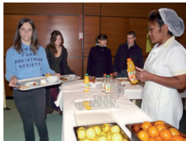
Céréales, laitages, jus de fruits, des plateaux plein d'énergie pour bien démarrer la journée.

La formule pour ce repas matinal était libre : aliments au choix, ambiance décontractée. Ce projet a été coordonné par