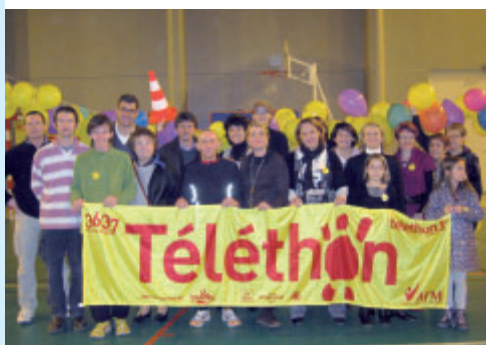
Les organisateurs du Téléthon.

Cette année, il a fallu redoubler d'efforts et de générosité pour que cette édition du Téléthon soit un succès. Malgré le mau-