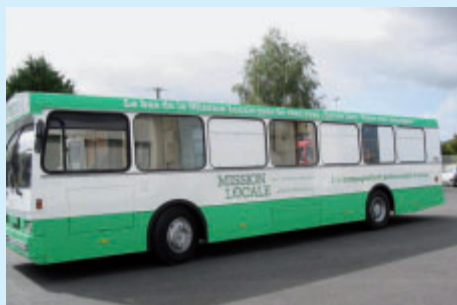
Le bus de la mission locale s'arrête deux fois par mois à Bouaye.

Depuis septembre 2009, le bus de la Mission Locale pour l'Emploi assure des permanences, place des Echoppes, deux mercredis par mois, de 14h à 17h . A son bord, un animateur et un conseiller en insertion sont à disposition des 16-25 ans non scolarisés et sans emploi pour les conseiller et les informer sur les métiers, les formations, la recherche d'emploi. Les prochaines permanences auront lieu les 13 et 27 janvier, 10 février, 3 et 24 mars, 7 et 21 avril, 5 et 19 mai et 9 et 30 juin 2010 ●