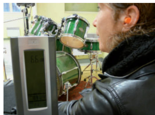
Un décibel-mètre et des bouchons d'oreilles sont mis à disposition des musiciens répétant au Bokal.

Local de répétition des musiques amplifiées de Bouaye, le Bokal met à disposition des groupes du matériel pour répéter dans des bonnes conditions. Le Bokal s'est doté, cette année, d'un décibel-mètre. Cet appareil mesure le volume sonore émis dans la salle. Ainsi, les musiciens peuvent régler les amplificateurs de leurs instruments lors des séances de répétition. Ce nouvel équipement s'ajoute aux bouchons d'oreilles jetables mis à disposition des groupes, depuis le mois de décembre. Généralement taboue, la prévention des risques auditifs doit pourtant être une préoccupation première chez les musiciens et les techniciens. Leurs oreilles sont aussi leurs outils de travail. L'Homme naît avec un capital auditif qui se détériore naturellement avec le temps et qui ne peut pas se régénérer. Ce capital peut aussi se détériorer plus vite qu'il ne le devrait - et de manière irréversible - lorsque les conduits auditifs sont trop sollicités (forts volumes et/ou longues expositions au bruit). Le Bokal recommande également de télécharger gratuitement l'excellent hors série du Tohu Bohu « Risques auditifs : pour un juste volume », www.trempo.com/Tohu-Bohu