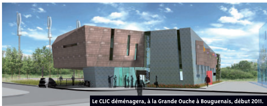
Le CLIC déménagera, à la Grande Ouche à Bouguenais, début 2011.

M-B. B : Cette aide devra faire l'objet d'une demande auprès du CCAS. Un dossier sera constitué par le demandeur et étudié en fonction de chaque situation en respectant le plus strict anonymat. Nous invitons les personnes intéressées à s'adresser directement au CCAS pour connaître les conditions et les modalités de demande d'aide en téléphonant au 02 51 70 55 57.