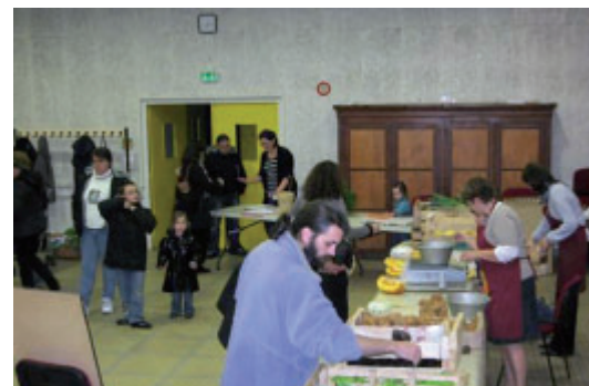
Les distributions de paniers bio se déroulent salle Eugène Lévêque.

les fruits et les légumes de saisons, des idées et des astuces pour cuisiner. Les personnes intéressées peuvent venir rencontrer les responsables du Panier Bioscéen lors des distributions hebdomadaires, lundi soir, de 17h30 à 19h30, à la salle Eugène Lévêque ou envoyer un message à lepanierbiosceen@yahoo.fr ●