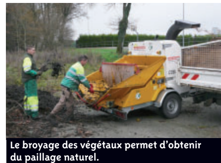
Le broyage des végétaux permet d'obtenir du paillage naturel.

Face au problème de la pollution des eaux par les pesticides, le Conseil municipal a voté l'instauration d'un plan de désherbage communal. Celui-ci permet d'adapter les méthodes de désherbage en fonction du risque de transfert de pesticides de chaque zone à traiter vers les cours d'eau. La commune mettra en œuvre progressivement l'usage de techniques alternatives au désherbage chimique, notamment : l'arrachage manuel, l'utilisation de paillage et de plantes couvre sol, le désherbage mécanique. Parallèlement, le Conseil municipal a approuvé la charte territoriale CREPEPP (Cellule Régionale d'Etude de la Pollution des Eaux par les Produits