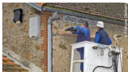
Pose de nichoirs pour oiseaux et de gîtes pour chauves-souris par les services communaux.

Les services techniques de la Ville ont installé des gîtes et des nichoirs pour préserver les chauves-souris et plusieurs espèces d'oiseaux de notre région.