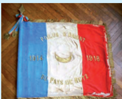
Le drapeau des Poilus d'Orient nécessite une restauration importante.

Le Conseil municipal s'associe à la Fondation du Patrimoine et l'UNC de Bouaye pour mettre en place un appel à souscription afin de restaurer le drapeau tricolore de la section des Poilus d'Orient du Pays de Retz. Actuellement très abîmé, cet objet historique appartenant au patrimoine boscéen nécessite une restauration professionnelle urgente pour être sauvegardé et conservé. Un premier drapeau a déjà fait l'objet d'un travail similaire : il est désormais exposé dans un meuble-vitrine, salle du Conseil municipal. Des bulletins de don sont disponibles en mairie et sur www.mairie-bouaye.fr