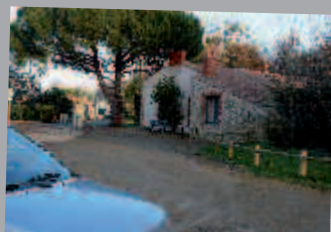
Banc, poubelle, appuis vélo et panneaux ont été installés sur l'aire de l'Etier.