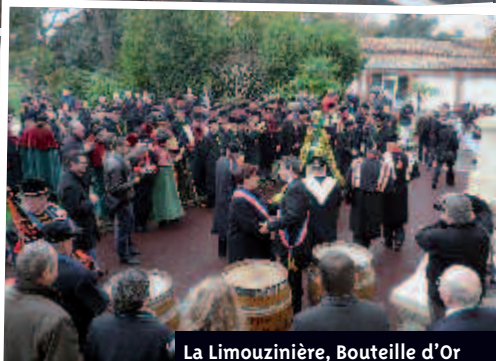
La Limouzinière, Bouteille d'Or 2009, remet le trophée à Bouaye.