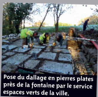
Pose du dallage en pierres plates près de la fontaine par le service espaces verts de la ville.