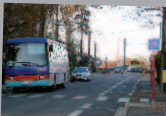
L'avenue du Bois dispose désormais de bandes cyclables.