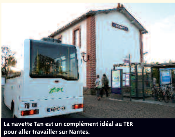
La navette Tan est un complément idéal au TER pour aller travailler sur Nantes.

Horaires complets sur www.mairie-bouaye.fr .