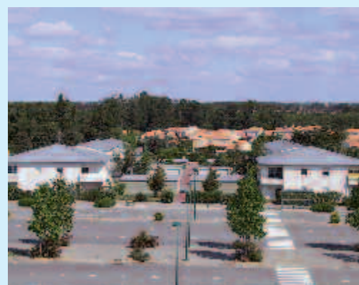
Un éco-lotissement achèvera la Zone d'Aménagement Concerté des Ormeaux

Mardi 25 janvier , la municipalité organise une réunion de quartier, à 20h, au lycée Alcide d'Orbigny. Cette soirée sera l'occasion de faire le point sur l'évolution du quartier, notamment sur le projet d'éco-lotissement qui achèvera la Zone d'Aménagement Concerté (ZAC). Cette réunion permettra également de répondre aux questions sur les divers projets en cours sur la commune.