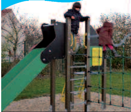
Dernière aire de jeux créée Avenue du Bois.