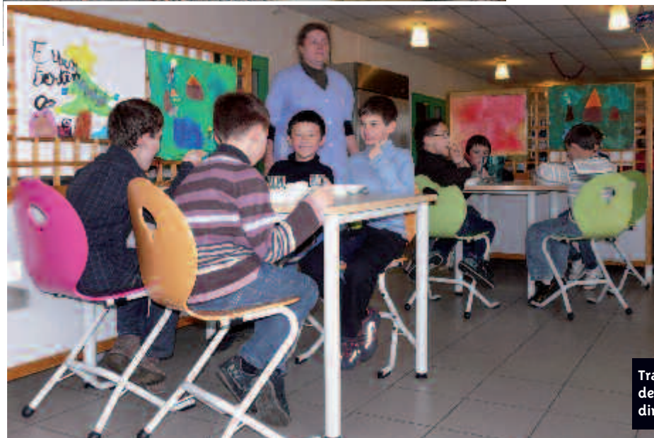
Traité acoustiquement, le nouveau mobilier de la restauration scolaire contribue à la diminution du bruit pendant les repas.