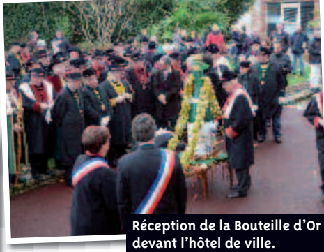
Réception de la Bouteille d'Or devant l'hôtel de ville.