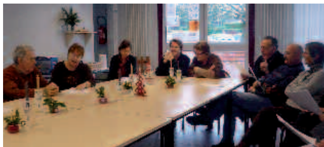
Une séance de musicothérapie est organisée une fois par mois par l'APAMA.