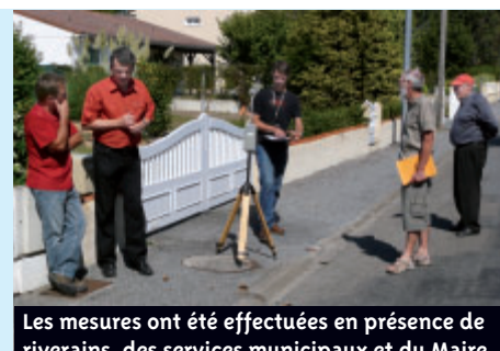
Les mesures ont été effectuées en présence de riverains, des services municipaux et du Maire.

A la demande de la Ville de Bouaye, la société Orange a missionné le laboratoire Aexpertise, accrédité par le Comité Français d'Accréditation (COFRAC) afin de réaliser des mesures de champs magnétiques autour de l'équipement de radiotéléphonie situé route de Bouguenais. Ces mesures ont été effectuées le 9 septembre dernier. L'association du lotissement de la Galimondaine s'interrogeait sur les conséquences possibles d'émission d'ondes en matière de santé publique. Les résultats de cette étude sont rassurants : ils attestent du respect des normes en vigueur. Les valeurs relevées représentent 3,4 % du seuil limite minimum en GSM (technologie de téléphonie mobile de deuxième génération) et 0,94 % du seuil limite minimum en UMTS (troisième génération «3G»). L'intégralité du rapport et ses annexes sont consultables en mairie ●