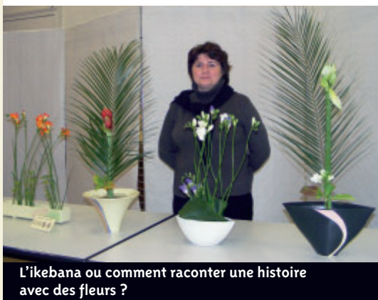
L'ikebana ou comment raconter une histoire avec des fleurs ?

choisi. Personnellement, je fais partie de l'école traditionnelle ikenobo , une des plus anciennes. Nous n'utilisons que du floral et du végétal. La composition doit raconter une histoire par rapport à un ressenti, à l'état d'esprit de son créateur.