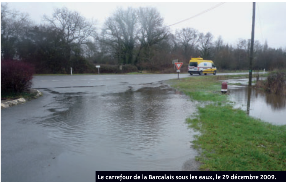
Le carrefour de la Barcalais sous les eaux, le 29 décembre 2009.

« Ainsi, conformément à la loi sur l'eau, toute nouvelle activité devra impérativement prévoir des dispositifs compensatoires pour neutraliser les effets de l'imperméabilisation des sols » conclut Christian Rivaud, adjoint à l'urbanisme ●