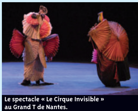
Le spectacle « Le Cirque Invisible » au Grand T de Nantes.