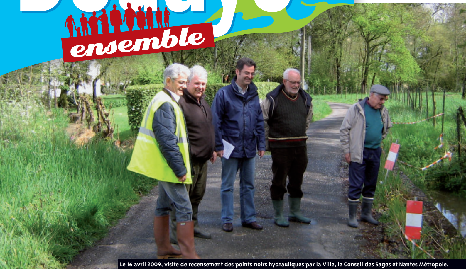
Le 16 avril 2009, visite de recensement des points noirs hydrauliques par la Ville, le Conseil des Sages et Nantes Métropole.