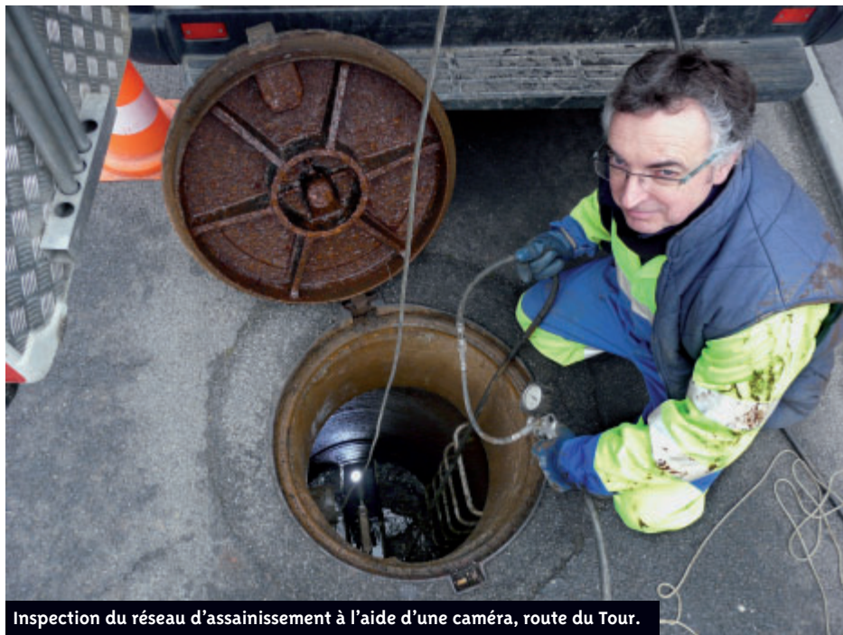
Inspection du réseau d'assainissement à l'aide d'une caméra, route du Tour.