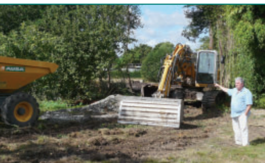
Christian Rivaud, Adjoint à l'urbanisme, a veillé au bon déroulement des travaux.

site de ces travaux. Cet ouvrage d'un coût de 120 000 € H.T. permettra à une vingtaine de foyers Boscéens d'être reliée au réseau d'assainissement collectif ●