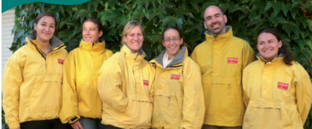
Les ambassadeurs du tri vont informer les Boscéens des nouveaux quartiers sur la gestion des déchets.