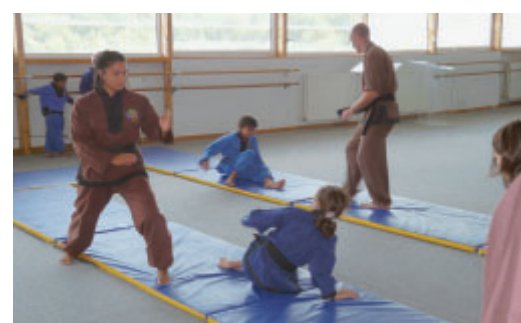
Adultes et enfants peuvent désormais pratiquer le Vo Viêt-Nam.

D epuis septembre, un nouveau cours pour adultes de Vo Viêt-Nam est enseigné le samedi, de 9h30 à 11h, salle des Ormeaux . Cet art martial traditionnel vietnamien était déjà enseigné aux 6-13 ans depuis l'année dernière, le mardi, de 19h15 à 20h15. L'apprentissage de la self défense peut être une des motivations des pratiquants. Cette discipline permet de travailler la souplesse, le renforcement du corps. Au programme : Apprentissage des positions de bases, des coups de pieds et coups de poings, sauts et roulades.