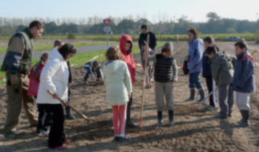
Les enfants des écoles vont semer les graines de la jachère fleurie.