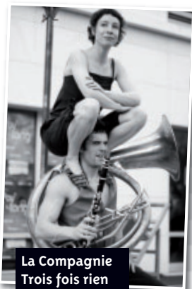
La Compagnie Trois fois rien