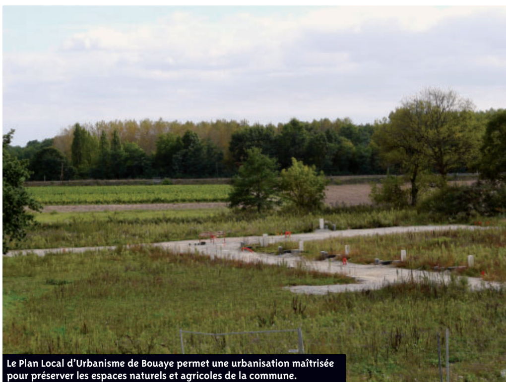
Le Plan Local d'Urbanisme de Bouaye permet une urbanisation maîtrisée pour préserver les espaces naturels et agricoles de la commune.