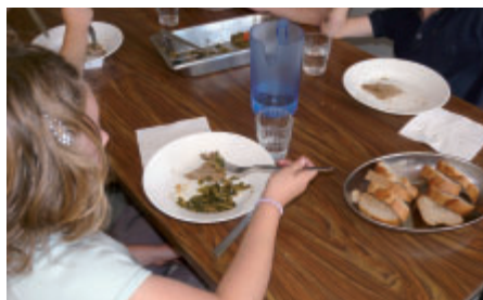
Le 23 septembre, pain bio, viande de porc bio et courgettes bio étaient au menu.

D ès septembre 2009, les écoliers ont mangé du pain bio à chaque repas. Ils ont trouvé sur la table, des desserts lactés (yaourts, fromages blancs), des céréales (maïs, blé, quinoa, semoule...) puis des