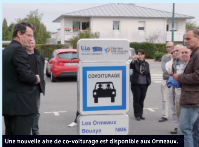
Une nouvelle aire de co-voiturage est disponible aux Ormeaux.

Pratique : le site Internet www.covoiturage-nantesmetropole.fr met en relation chauffeurs et passagers effectuant des trajets entre Bouaye et l'agglomération nantaise, voire au-delà. Gratuit, ce service permet de trouver des compagnons de route en quelques clics.